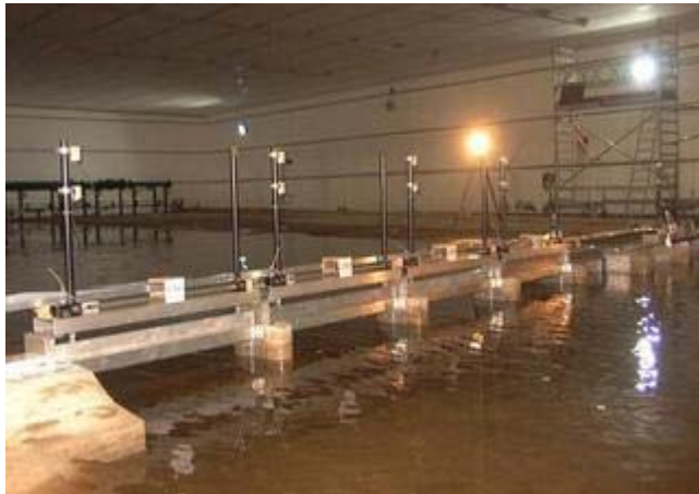
Ein Modell des Ems-Sperrwerkes im Franzius-Institut in Marienwerder.

Mit einer in Deutschland einzigartigen Wellenmaschine können Forscher in Hannover künftig den Hochwasserschutz optimieren.